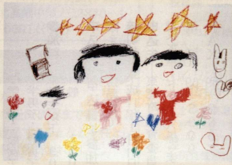
▲「わたしとおともだち」