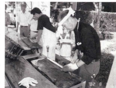
「うなぎのさばき方」