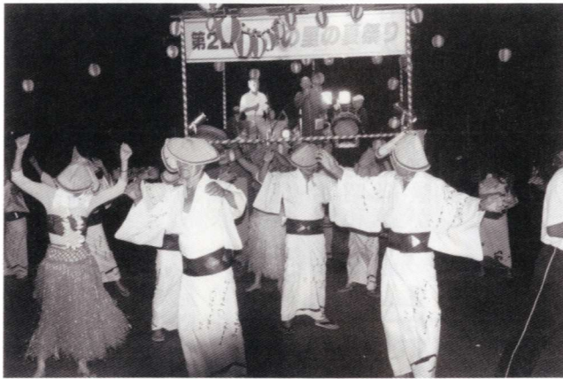
「高鍋音頭を踊る盆踊り愛好会の人達」