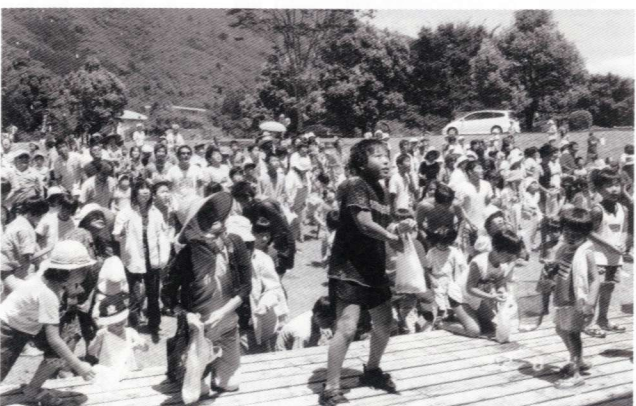
「景品付きもちまき」