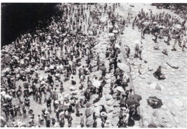
「大勢のつかみ取り参加者」

8月4日(日)、牧水公園河川プールで、牧水ふれあいうなぎつかみ取り大会が開催されました。台風の影響で1週間延期となった大会でしたが、つかみ取り開始時間の1時間前には、駐車場が満車になるほど親子連れなど大勢の人で賑わいました。 このイベントは、毎年商工会青年部が企画運営しているもので、今年もうなぎ(千匹)や、鯉・ます(五百匹)などが放流されました。参加者は、係員の合図で一斉に河川プールに飛び込み、まさに芋の子を洗うような混雑を見せました。指の間からすり抜けるうなぎに歓声を上げるなど、子供達も夏休みの楽しい思い出ができたようです。 また、耳川漁協の組合員が、捕まえたうなぎをさばいてくれるコーナーや、商工会のバザー、ふるさと市場の開設、景品付の餅まきなどもあって大会を盛り上げました。