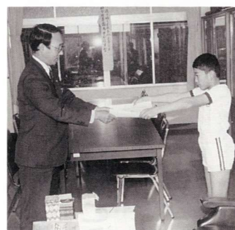
▲福良坪谷郵便局長から表彰を受ける寺原君