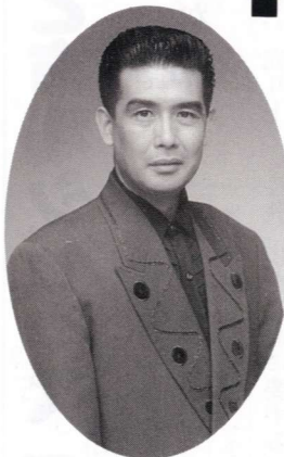
今年の公民館対抗歌合戦のゲスト角川 博