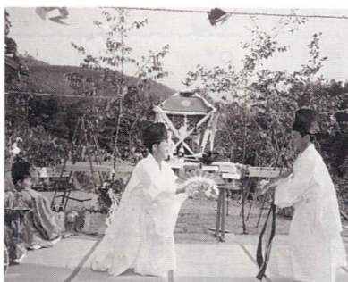
▲ふるさと越表の秋まつり

悪童達が近づいては逃げ、逃げは近づくと、最後までまつわり歩いていました。いつだったか、勢い余った若者達が、神輿ごと道下へ落ちた事があった、神輿は大破し長老達からひどく叱られていたのを思い出します。