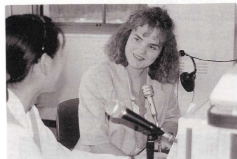
▲「ふれあい通信」での英会話ミニレッスンのようす

16世紀と17世紀にかけて、アイルランド全体がイギリスの支配下にあり、古いケルト制度が廃止されました。アイルランド、特に北の方のアルスタという地区は、宗教上の相違もあって土着の人々が同化しなかったため、イングランド及びスコットランドからの移民者に没収され、植民地