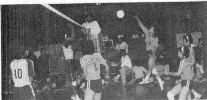
▲ スパイク一発！ 公民館対抗バレーボール大会