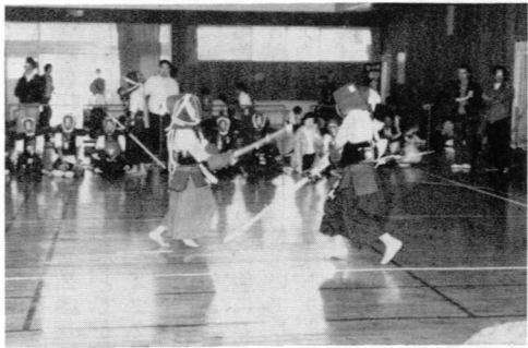
▲ 小手一本決まり！ 少年剣道大会