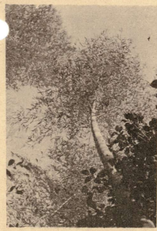
よりあひて 真すぐに立てる 青竹の 藪のふかみに 鶯の啼く 牧水