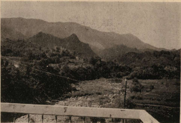
牧水記念館より尾鈴連峰をのぞむ