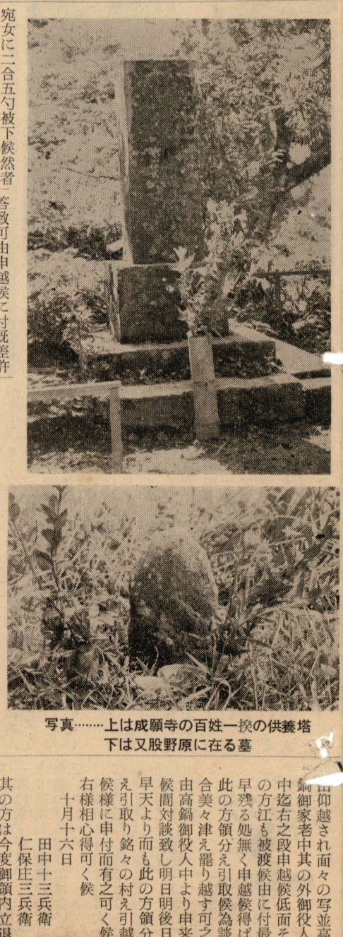
写真……上は成願寺の百姓一揆の供養塔 下は又股野原に在る墓