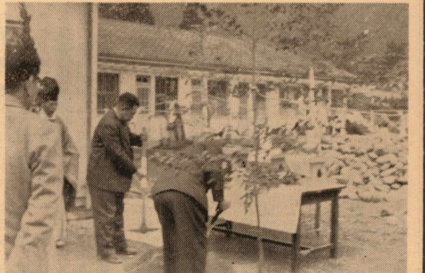
伝染病棟起工式 1月9日、東郷診療所の伝染病棟の起工式が行はれた。三月末竣工の予定、工費650万円