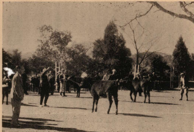
中央文化祭畜産展風景

十一月二十三日の「勤労感謝の日」に寺迫公民館の文化祭に始まり、十二月五日の福瀬公民館の文化祭で村内十一の分館文化祭が全館終わったが、分館文化祭も一年と充実の一途をたどっていることは、誠にうれし