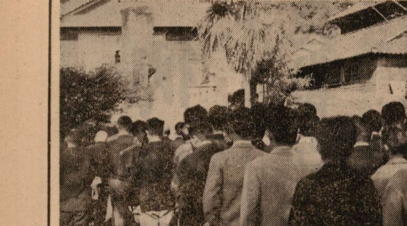
① 寺野内 ② 寺野内 ③ 寺野内 ④ 野深の獅子舞 ⑤ 野深の獅子舞 ⑥ 野深の獅子舞

育の進展に努むべきである と思はれる。 尚中学校における図書と技術 教育の面では多額の経費を伴 つては多額の経費を伴