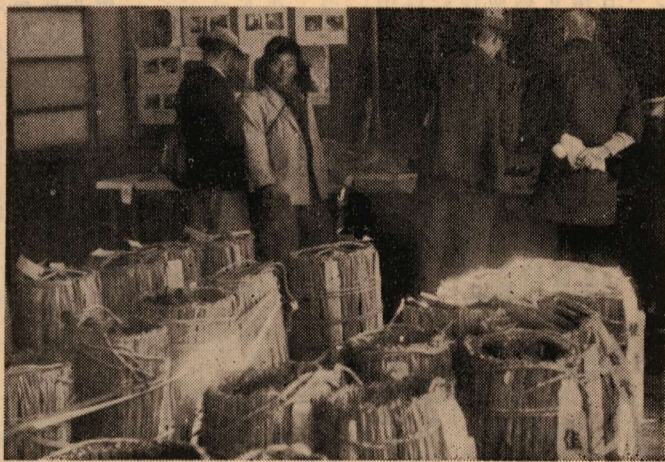
中央文化祭林産品展風景

この審査については、その審査の基準について一考を要する点があるようだ。しかし数年前に比して栄養価の高い野菜がどの菜園にも作られるようになったことはやはり家庭菜園審査に負うところが大きい。今後の問題としては生で食する葉菜類は堆肥と化学肥料で栽培する清浄野菜とし