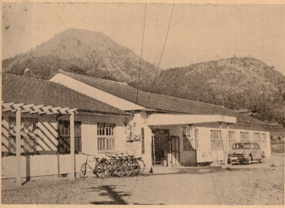
開設五周年を迎えたわたしたちの直営診療所

昭和二十九年六月診療所を開設し五年を迎え村民各位の御協力を感謝申し上げます。今一層診療所を利用することに努めていただきますことを願っています。 職員二名計十一名であり、そのうち医師二名、看護婦五名、その他職員四名です。診療所は、国民健康保険の被保険者を対象に開業してまいりましたが、二年の間に一人が一回半位病気をやがをする計算になりました。その他から一〇〇万円程度の繰り入れ状況であり、その運営の強化に苦慮している現状であります。 九千人は他の医療機関を利用している現状であります。勿論この六五%の中には眼科、歯科、産婦人科等の専門医もいます。地域的に村に開業の医師の利用もなされるものであり、尙又寺田の間の全般的診療所利用は不可能の現状にはありますが、各医療担当者（医師）からの請求書を見ますと診療所が充分処置できる病気をわさ／＼村外の遠い医療機関に運んでくる面も多く見受けられます。 病気が必ず当初に診療所の医師に相談していただき度い。診療所は村民の施設であり村民の健康を守る相談室でもあります。 病気の治療はもとより病気の予防に努めようとするため、話し相手にもなります。どうぞ、御利用下さい。 こゝに診療所開設五周年を迎え、国民健康保険の仕事を、特に診療所の運営強化について、村民各位の更なる御協力をお願いする次第です。