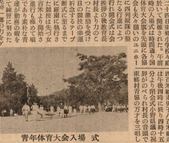
青年体育大会入場式

編集後記 ▲九月二十九日の夕刻から 翌三十日朝にかけて襲来 した第二十二号台風は本 村に大きな爪あとを残し て去つた。 豊稔の秋を自健の間に迎 えて明るく生活であつた 農民の顔は一瞬に消えて 憂鬱そのもの空と化した。 昨年十二号台風によ りに再び一億に近い被 害を受けたのであるから これが復旧は誠に難事だ ある。然しわれ等の村は われ等の力で復旧するよ り外に道はない。他力本 願では駄目である。お互 が力を合せ、励み合ひ 援けあつて復旧につとめ よう。 草紅葉